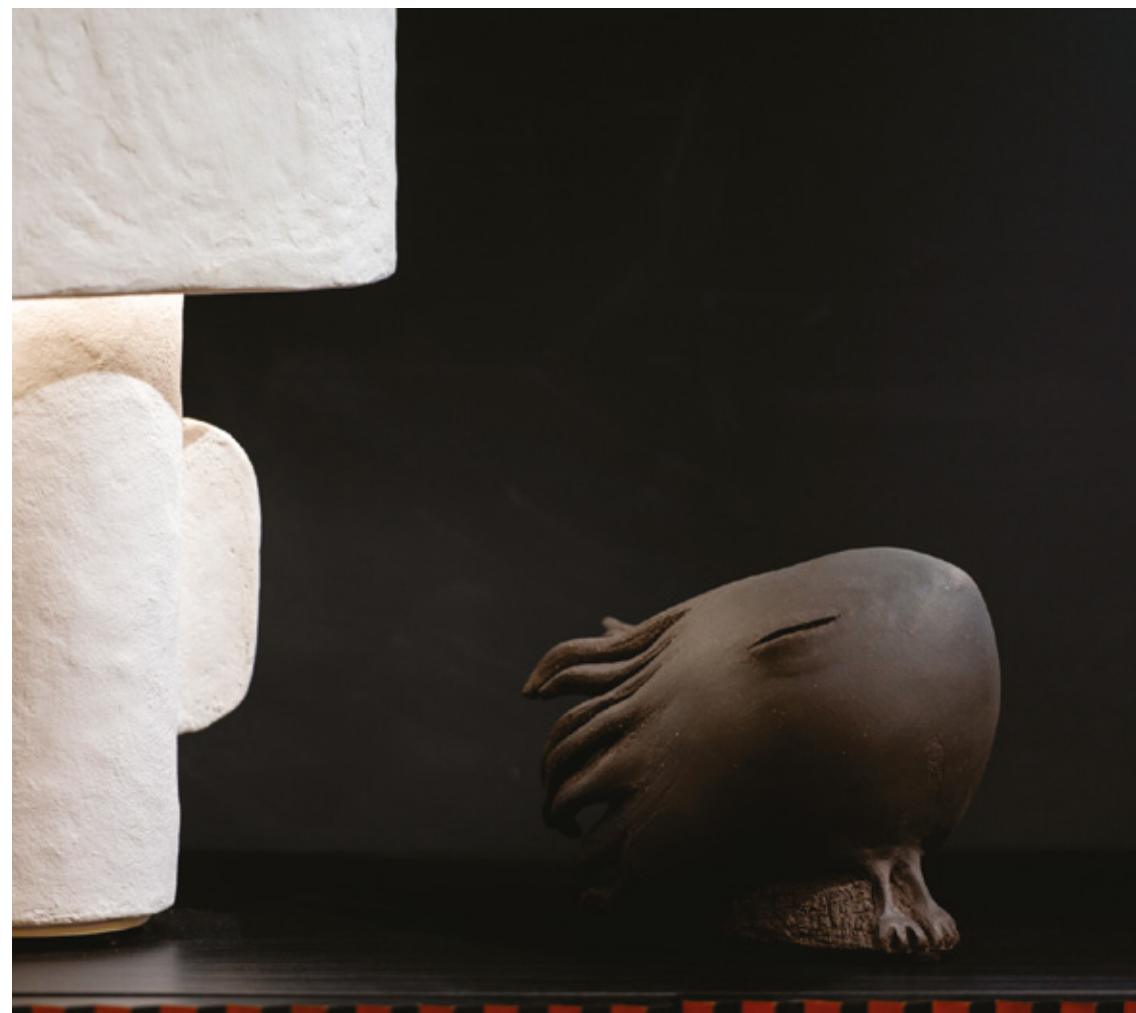
Sirius Exposition showroom Art et design : « Intemporel-Home » (Saint-Égrève - 38)

Premier prix de sculpture Concours « Les Automnales du Fort » (Barraux - 38)