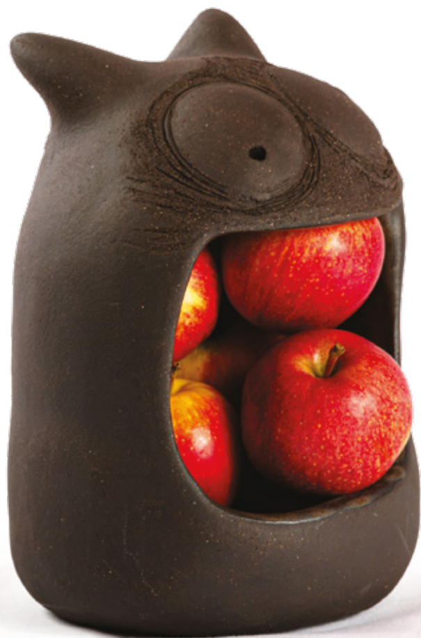
Alma des mela grès noir - 2022 24 x 18,3 x 17,6 cm