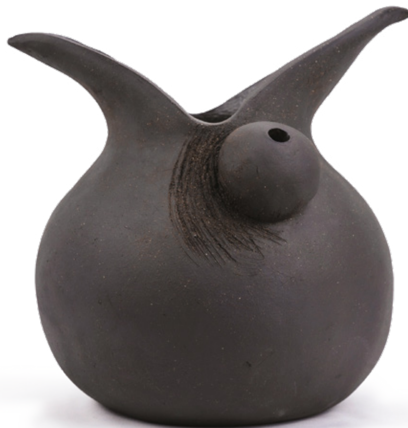
Alpeas des vases grès noir - 2022 21,5 x 20,5 x 21,2 cm