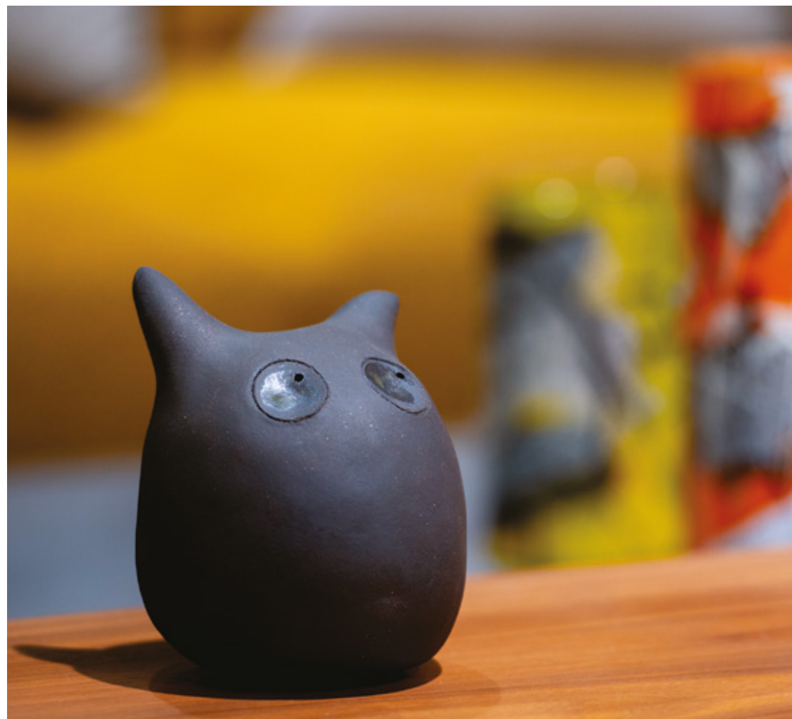
Orion grès noir - 2023 15,1 x 13,3 x 13,3 cm Exposition showroom Art et design : « Intemporel-Home » (Saint-Égrève - 38)