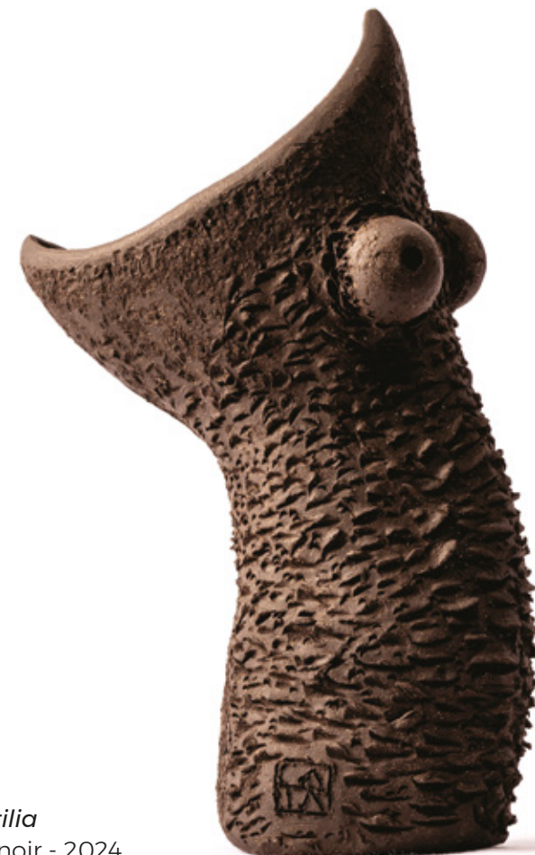
Nautilia grès noir - 2024 28,6 x 12,1 x 17,6 cm

Ce grès sombre et sobre contraste avec le caractère loufoque et le ton léger des coquecigrues, soulignant ainsi leur singularité.