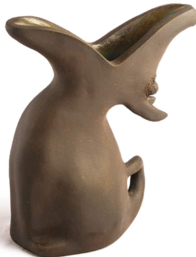
Véga grès noir - 2023 28,8 x 17,6 x 18,7 cm