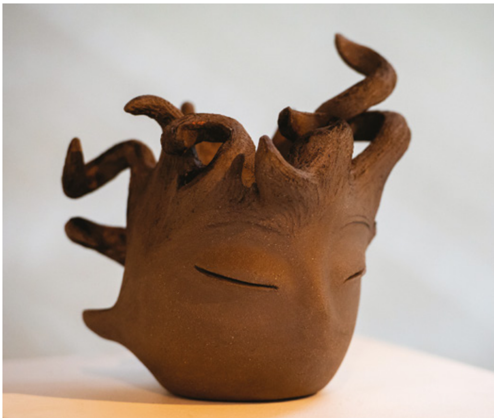
Saraph grès noir - 2025 19 x 16 x 17 cm Exposition : « Printemps des arts 2025 » (Espace culturel Aragon - Villard-Bonnot - 38) Concours K-droz - Thème « Le feu »