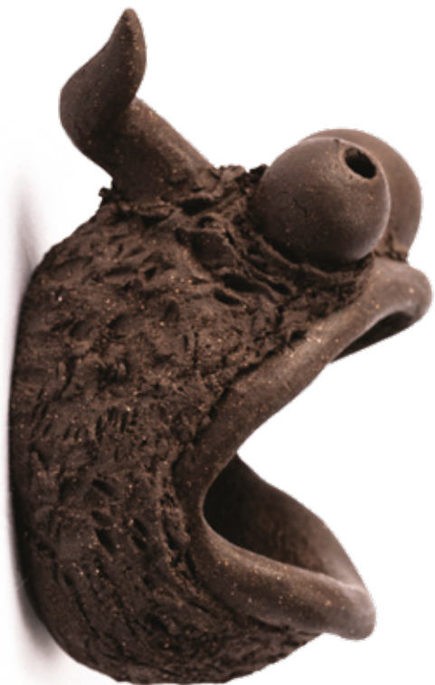
Ikthus grès noir - 2024 13,5 x 14,9 x 8,9 cm

Ma pratique s'inspire de la nature, de personnages BD, de dessins animés ou de gargouilles antiques... sans aucune logique ni hiérarchie.