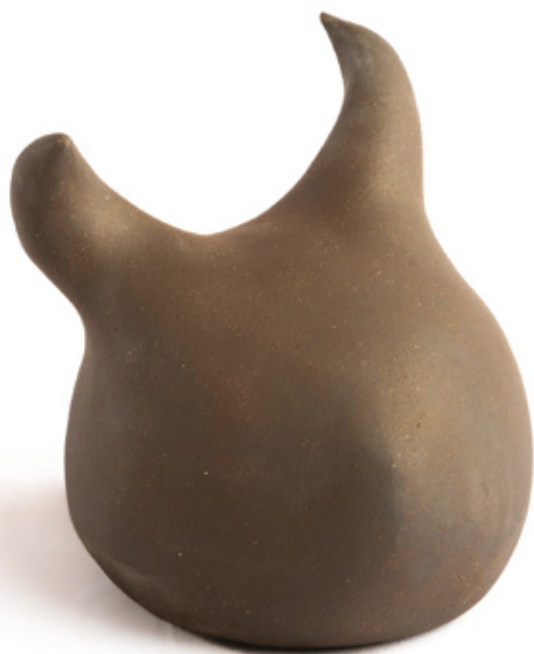
Rigel grès noir - 2023 15,5 x 15,2 x 15,6 cm