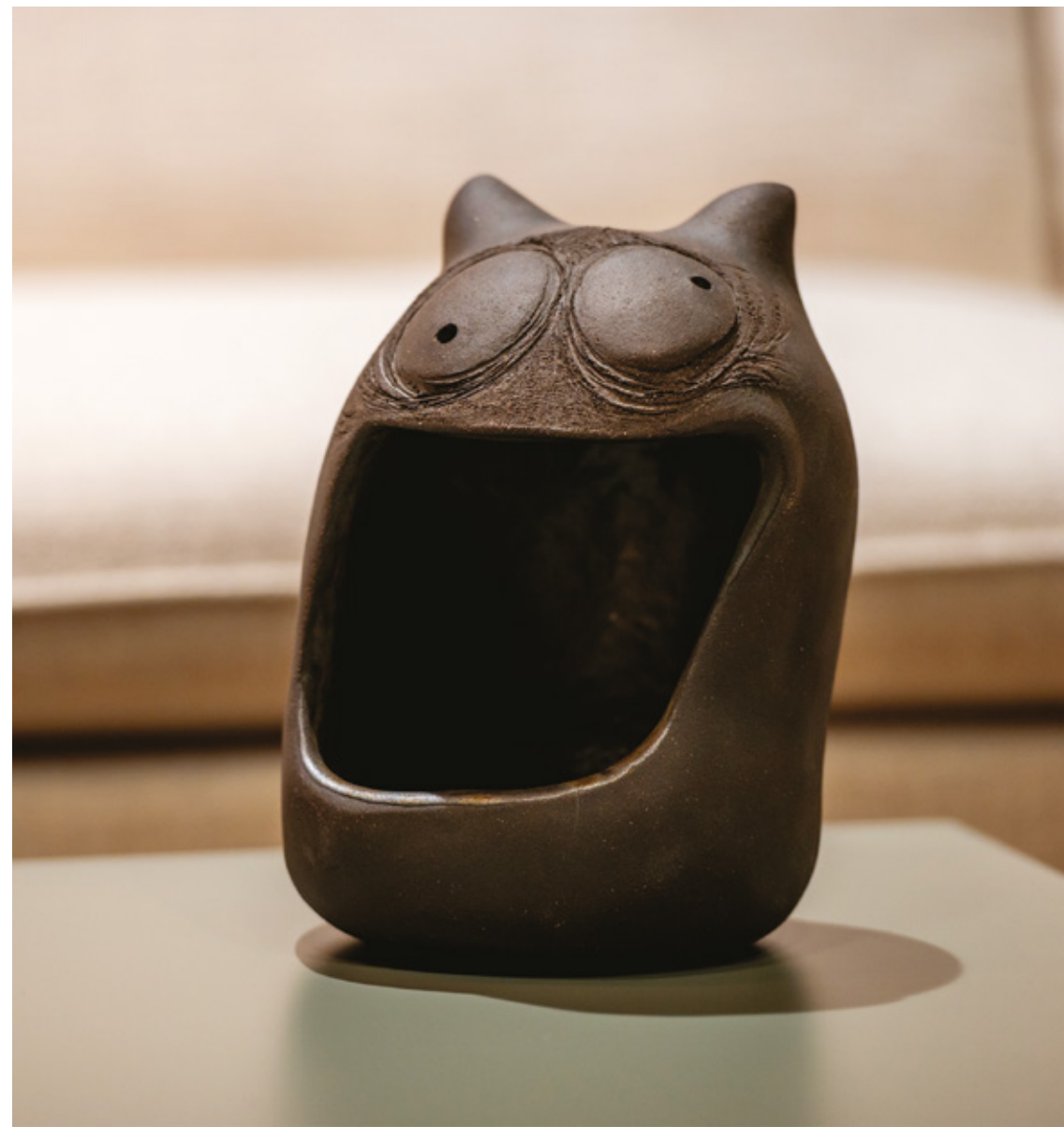
Alma des mela Exposition showroom Art et design : « Intemporel-Home » (Saint-Égrève - 38)