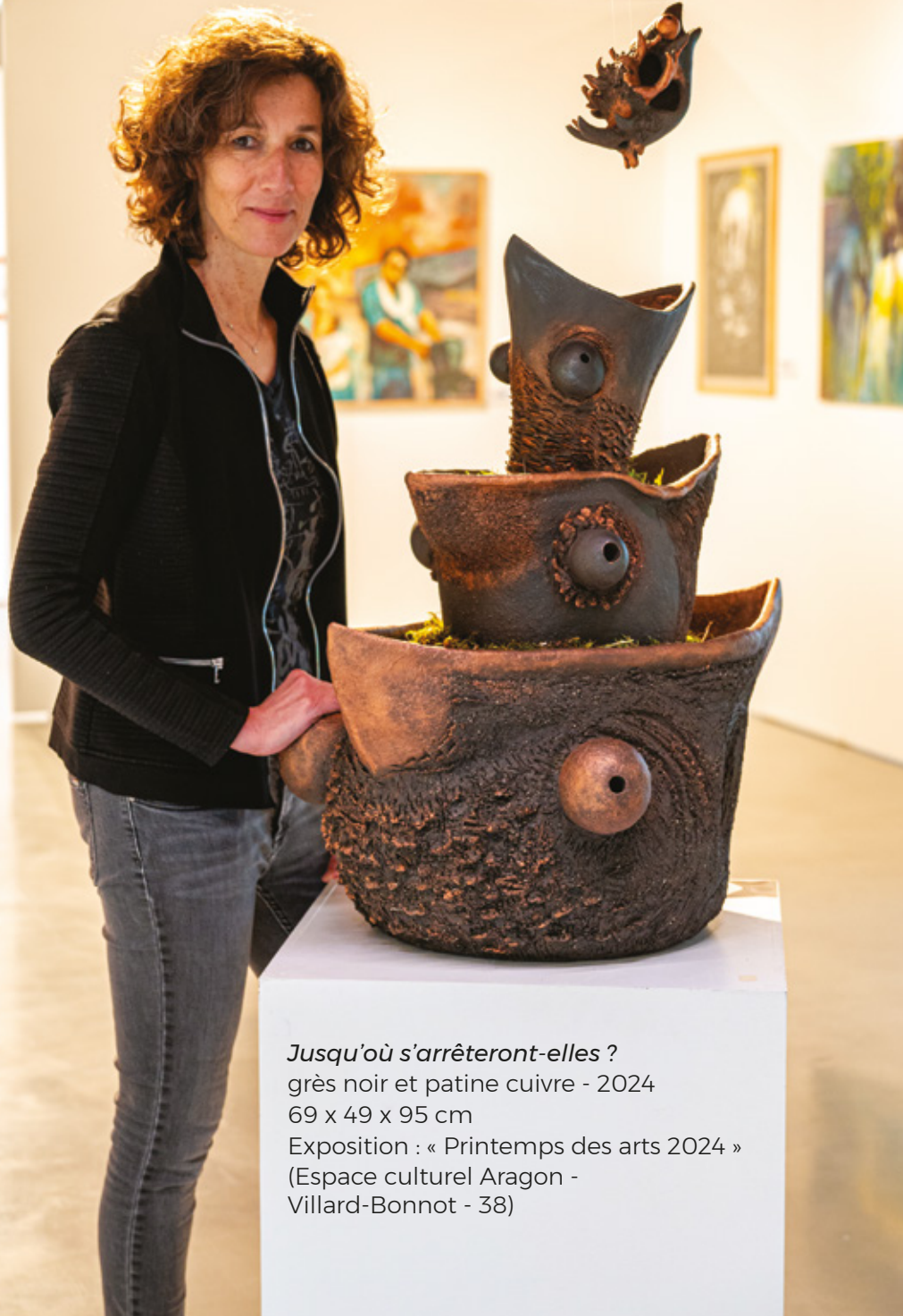
Jusqu'où s'arrêteront-elles ? grès noir et patine cuivre - 2024 69 x 49 x 95 cm Exposition : « Printemps des arts 2024 » (Espace culturel Aragon - Villard-Bonnot - 38)

CATA, artiste plasticienne et céramiste contemporaine, crée un univers original, peuplé de créatures saugrenues appelées « coquecigrues », en référence à Rabelais.