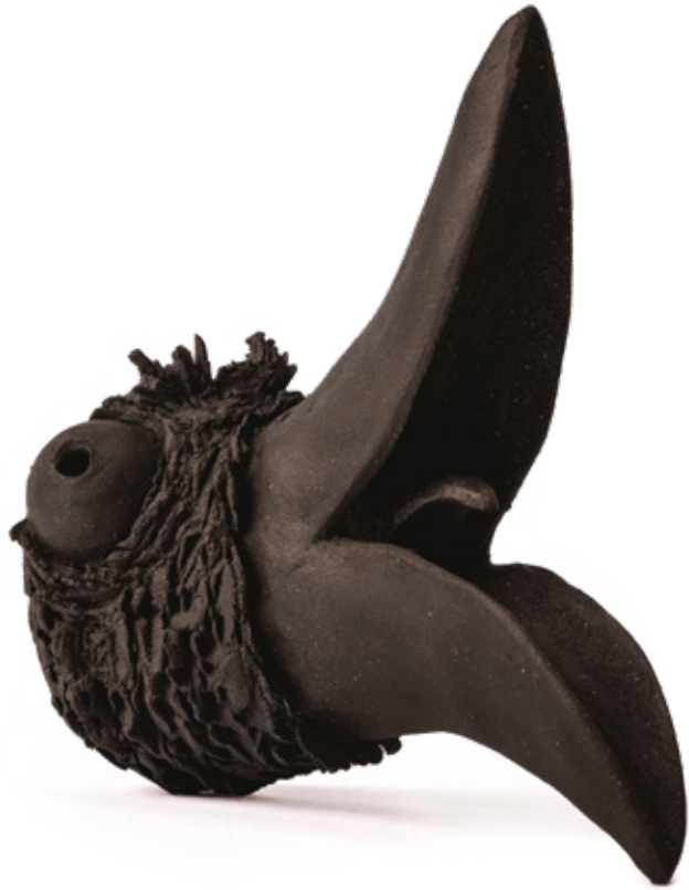
Erodiôs grès noir - 2024 12 x 20,5 x 19,2 cm