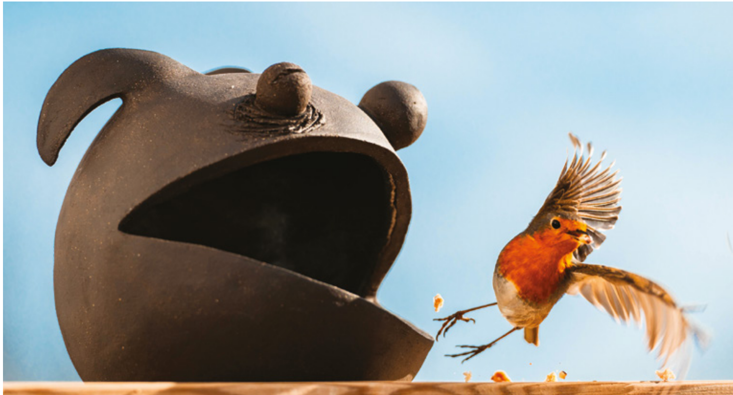
Sornette à cornette (et rouge-gorge) grès noir - 2022 - 19,5 x 20 x 17,8 cm