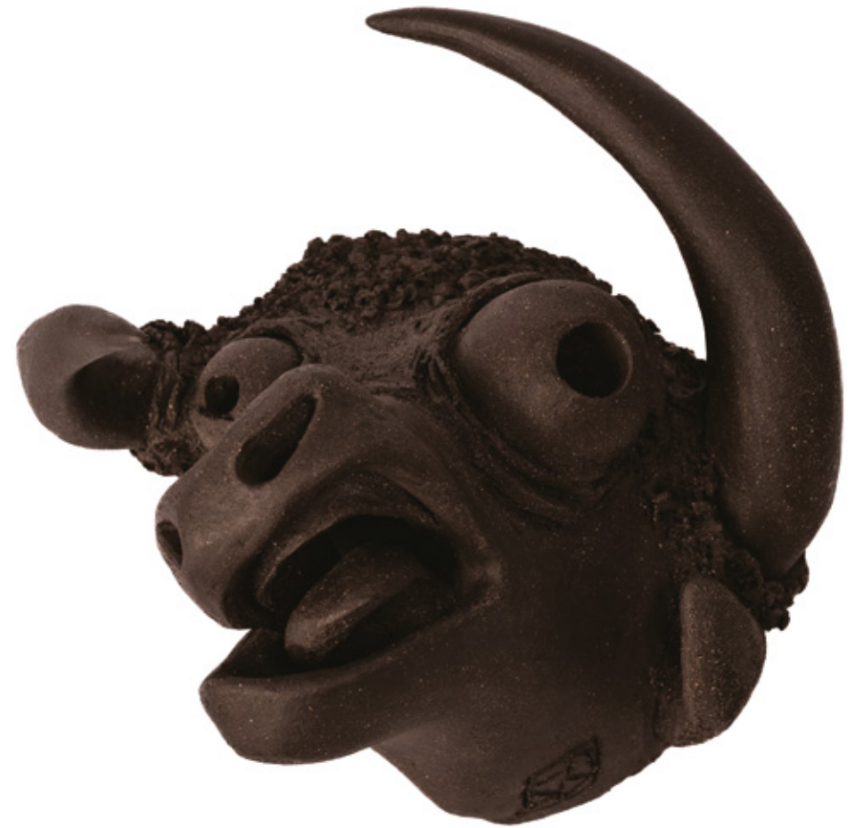
Nemausus Hilarus grès noir - 2024 18,7 x 19,5 x 12,5 cm