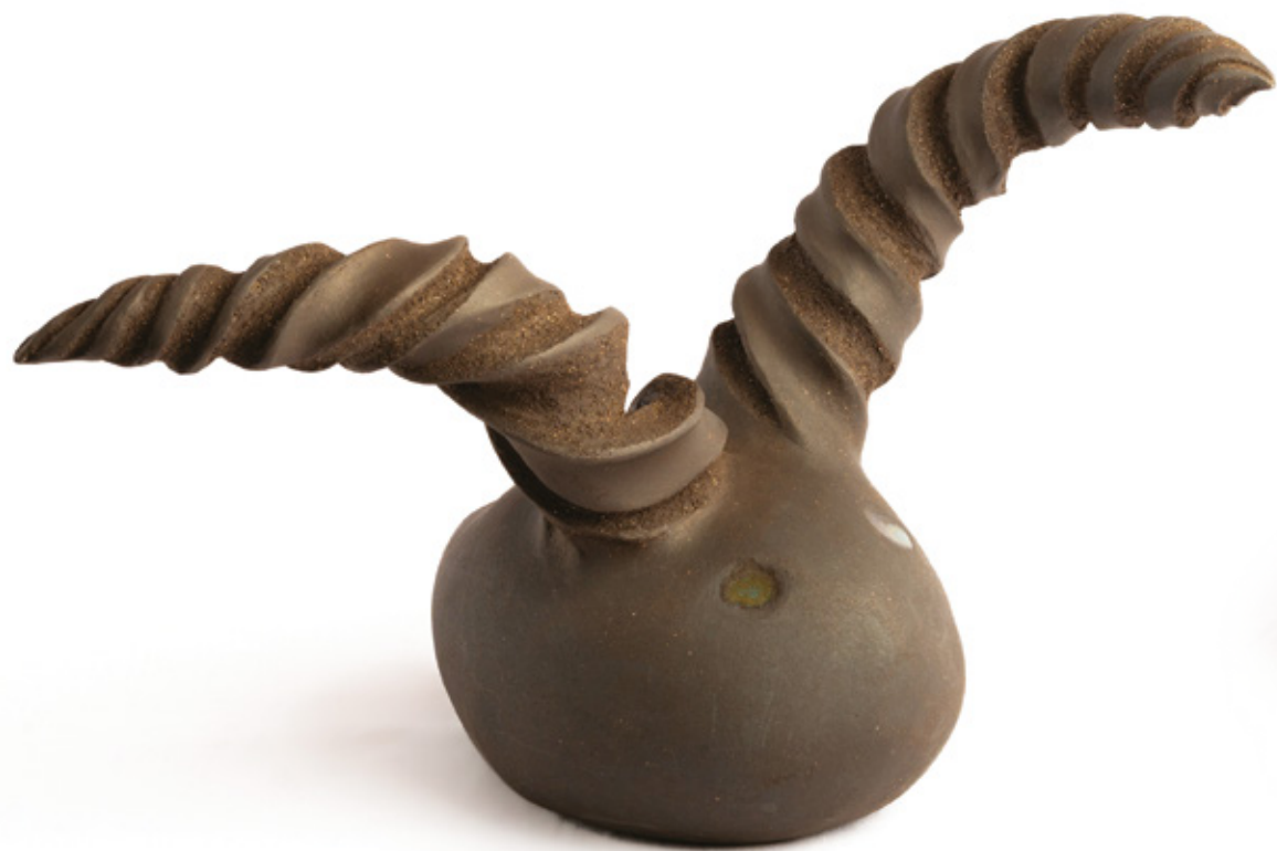
Betelgeuse grès noir - 2023 24,7 x 22,3 x 38,6 cm