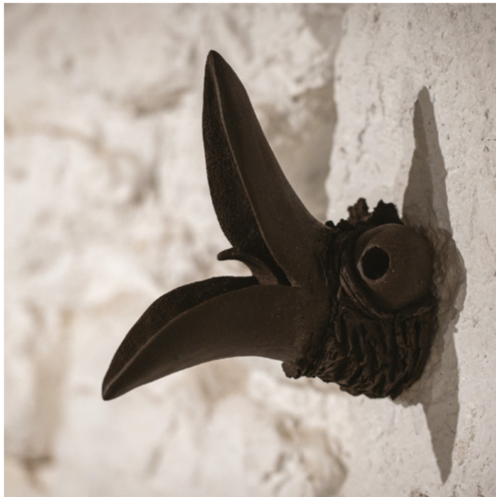
Erodiôs grès noir - 2024 12,0 x 20,5 x 19,2 cm