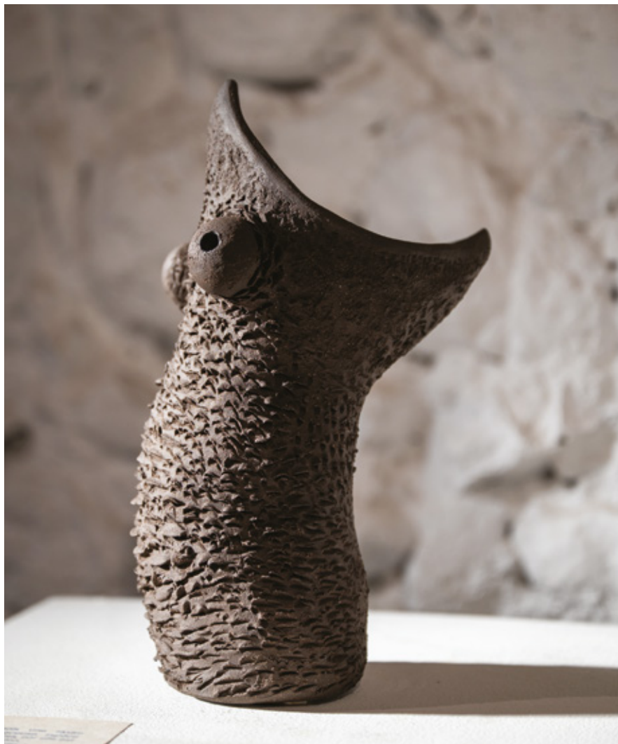
Nautilus grès noir - 2024 28,6 x 12,1 x 17,6 cm