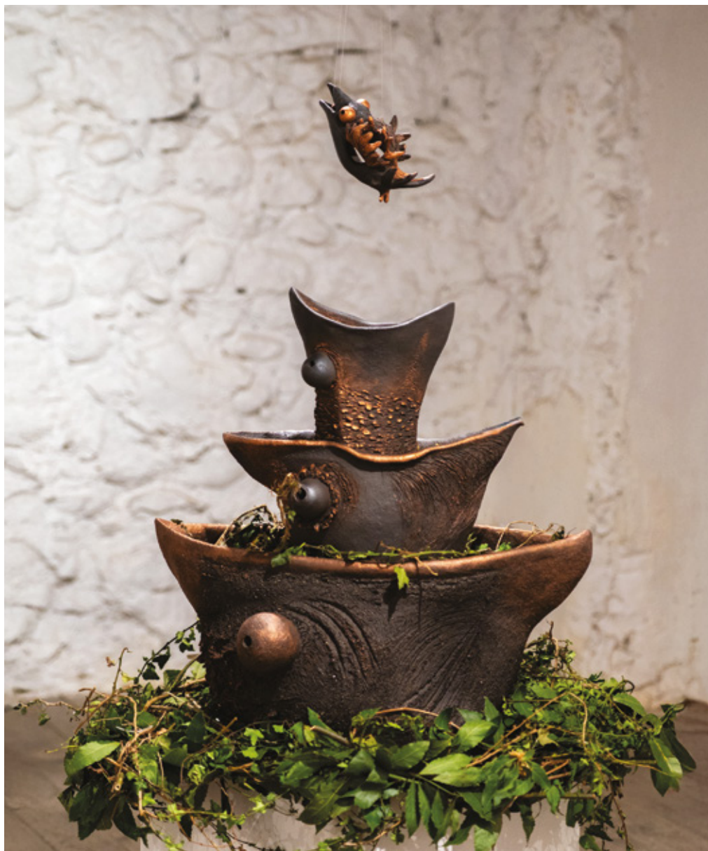
Jusqu'où s'arrêteront-elles ? grès noir et patine cuivre - 2024 69 x 49 x 95 cm