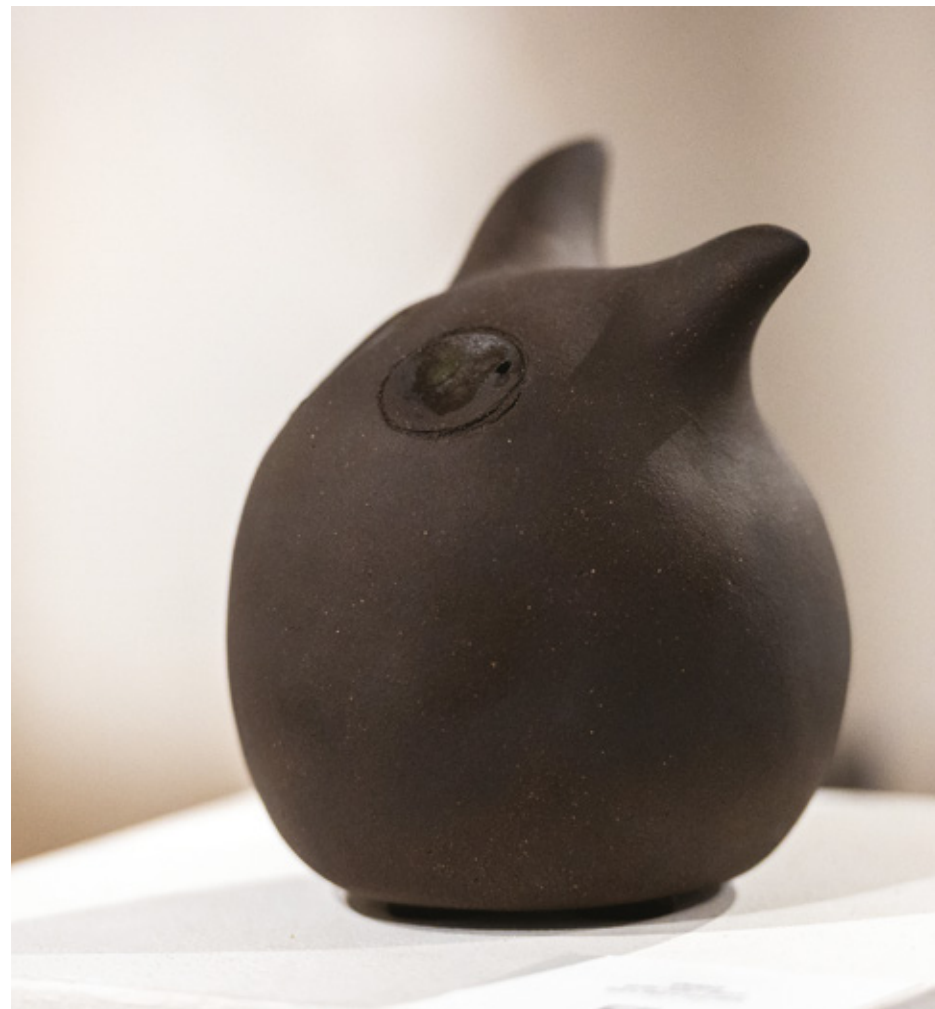
Orion grès noir - 2023 15,1 x 13,3 x 13,3 cm