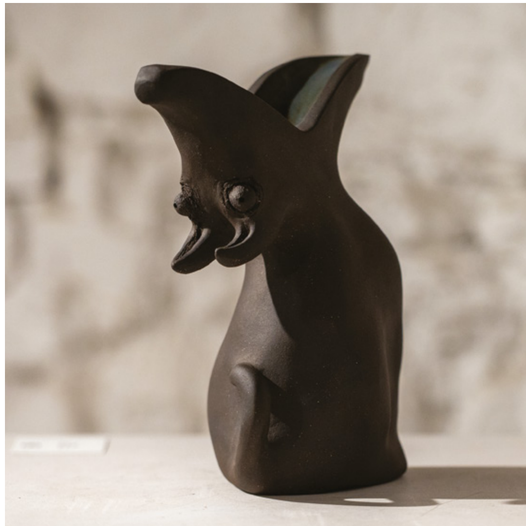
Véga grès noir - 2023 28,8 x 17,6 x 18,7 cm