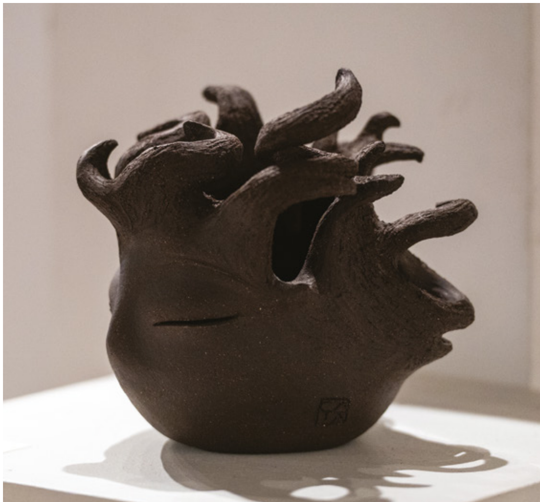
Saraph grès noir - 2025 19 x 16 x 17 cm