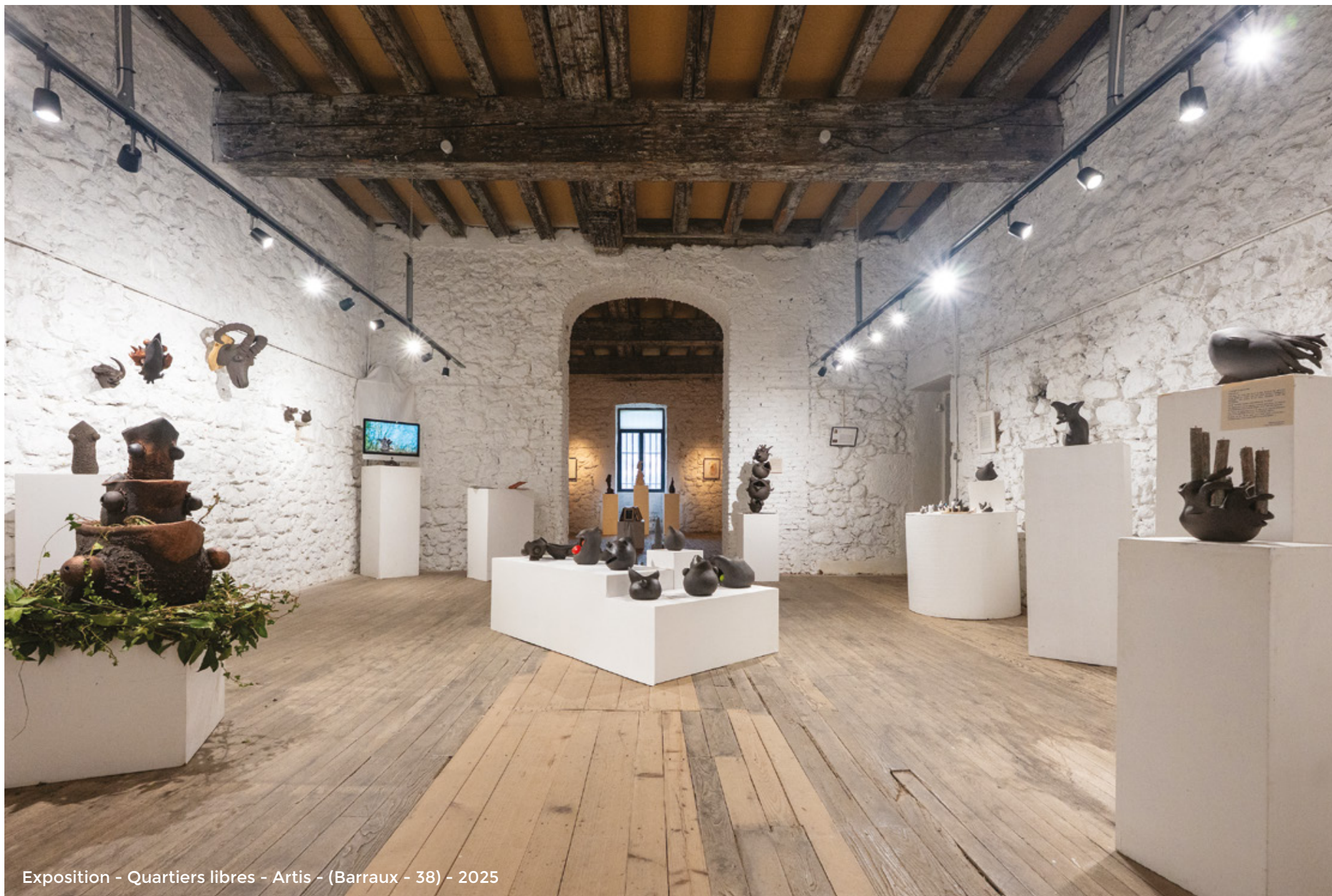
Exposition - Quartiers libres - Artis - (Barraux - 38) - 2025