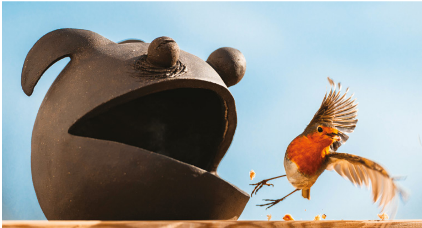
Sornette à cornette (et rouge-gorge) grès noir - 2022 - 19,5 x 20 x 17,8 cm