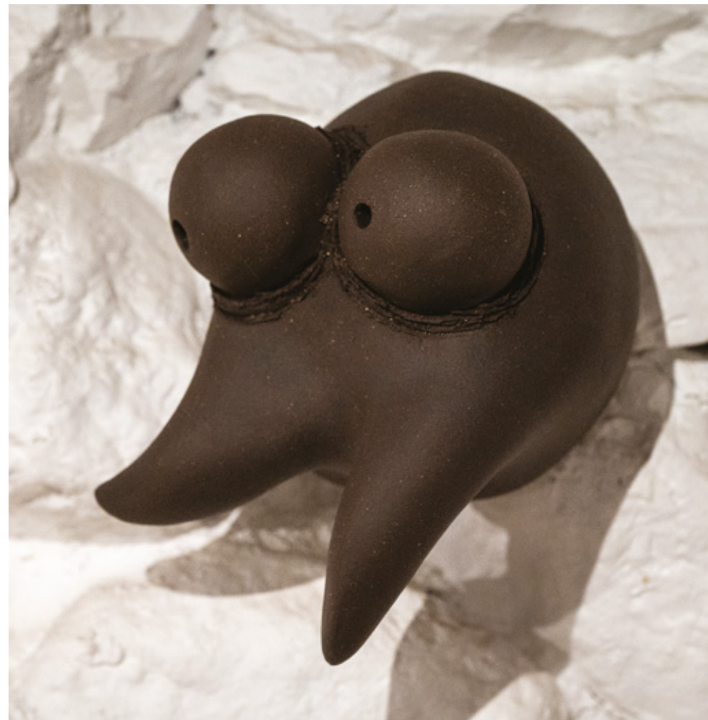
Blops grès noir - 2025 140 x 160 x 180 mm