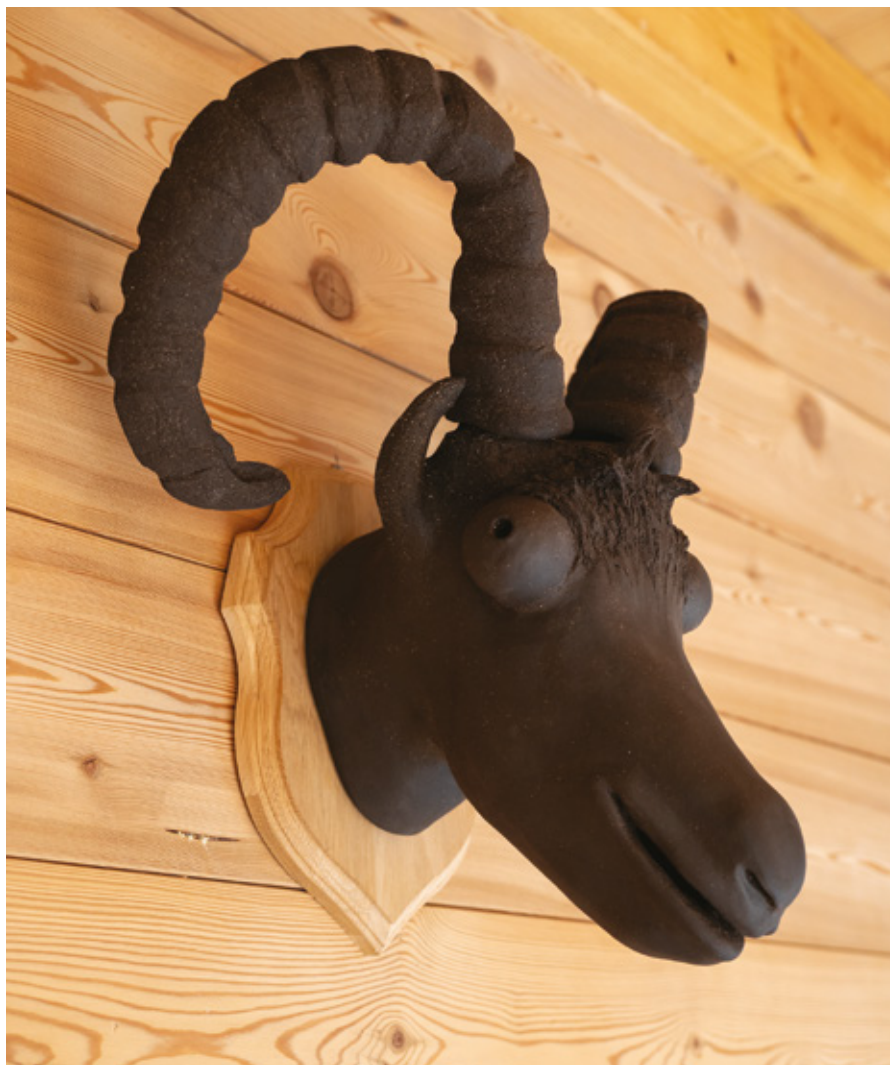
Bouquetin grès noir sur support bois - 2024 46 x 47 x 30 cm