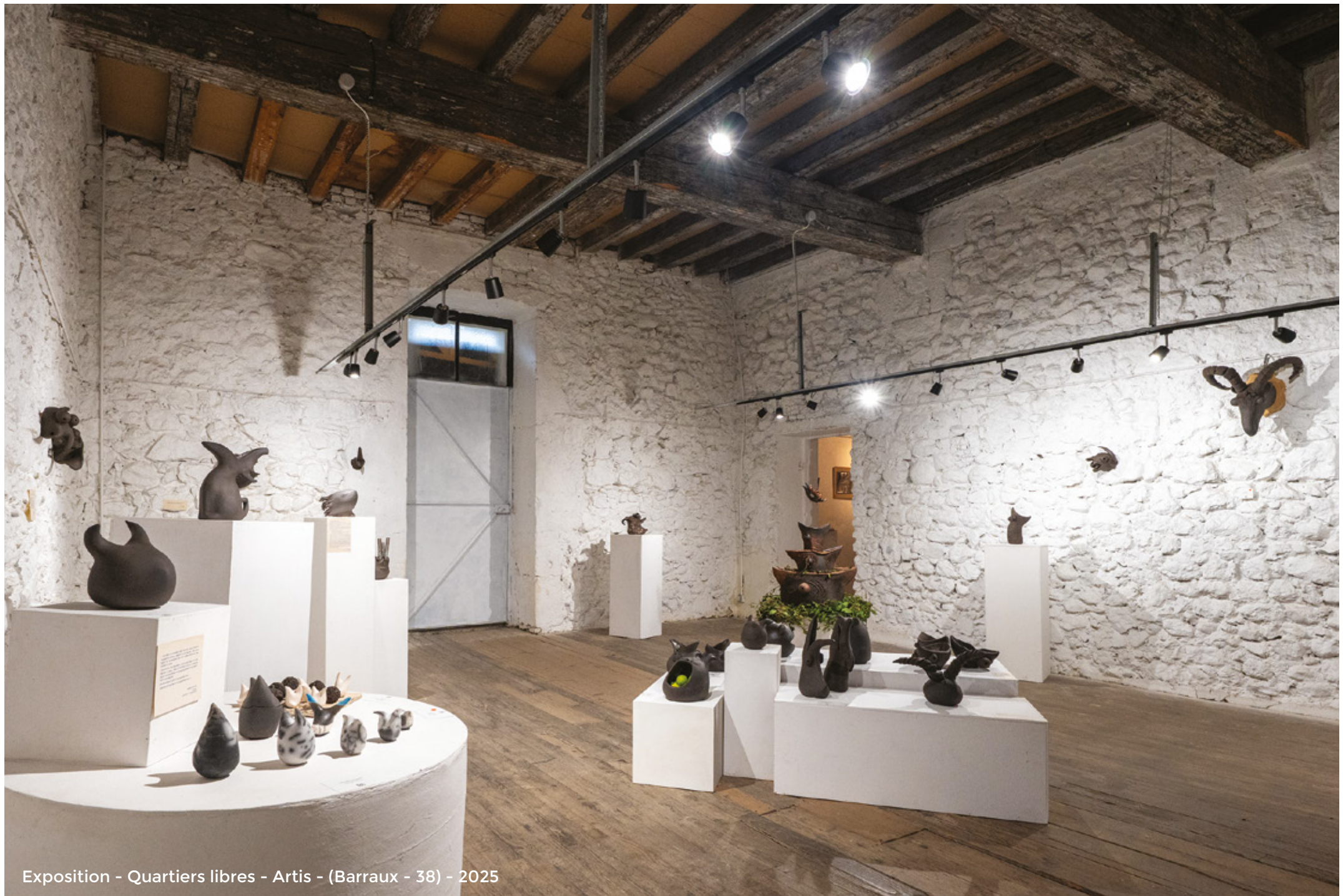
Exposition - Quartiers libres - Artis - (Barraux - 38) - 2025