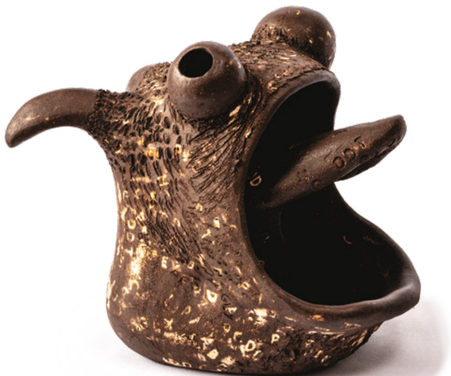
Pollux grès noir et engobe de porcelaine blanche - 2024 21,8 x 18,8 x 25,9 cm