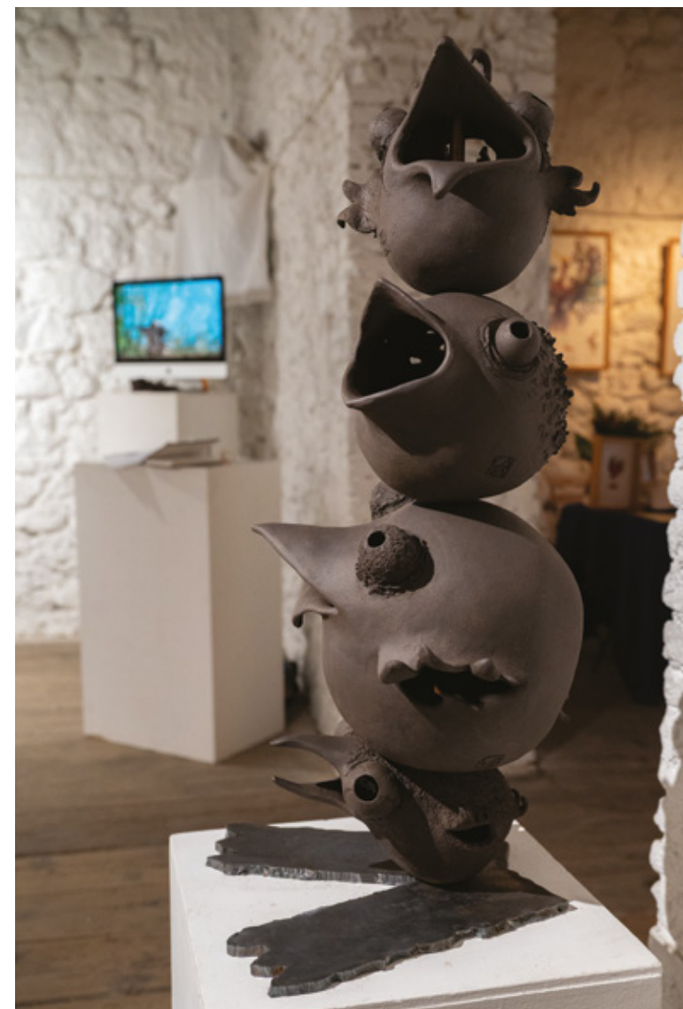
Coquecigrues de Brème grès noir et métal - 2025 400 x 400 x 800 mm

Exposition « Quartiers libres » (Barraux - 38) - 2025