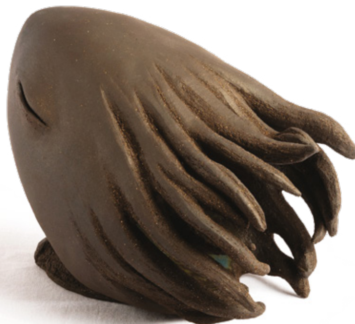
Sirius grès noir - 2023 16,8 x 22,8 x 16 cm

Premier prix de sculpture Concours « Les Automnales du Fort » 2023 (Barraux - 38)