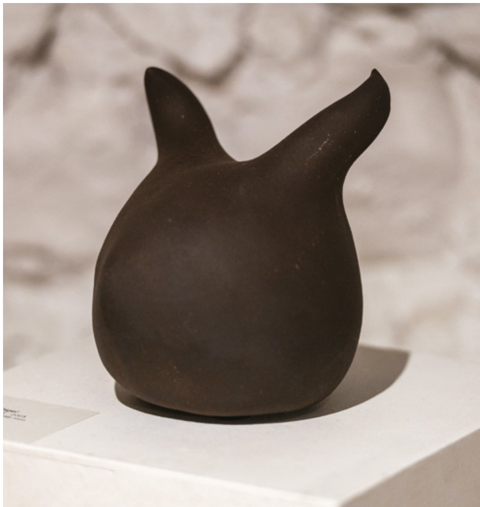
Rigel grès noir - 2023 15,5 x 15,2 x 15,6 cm