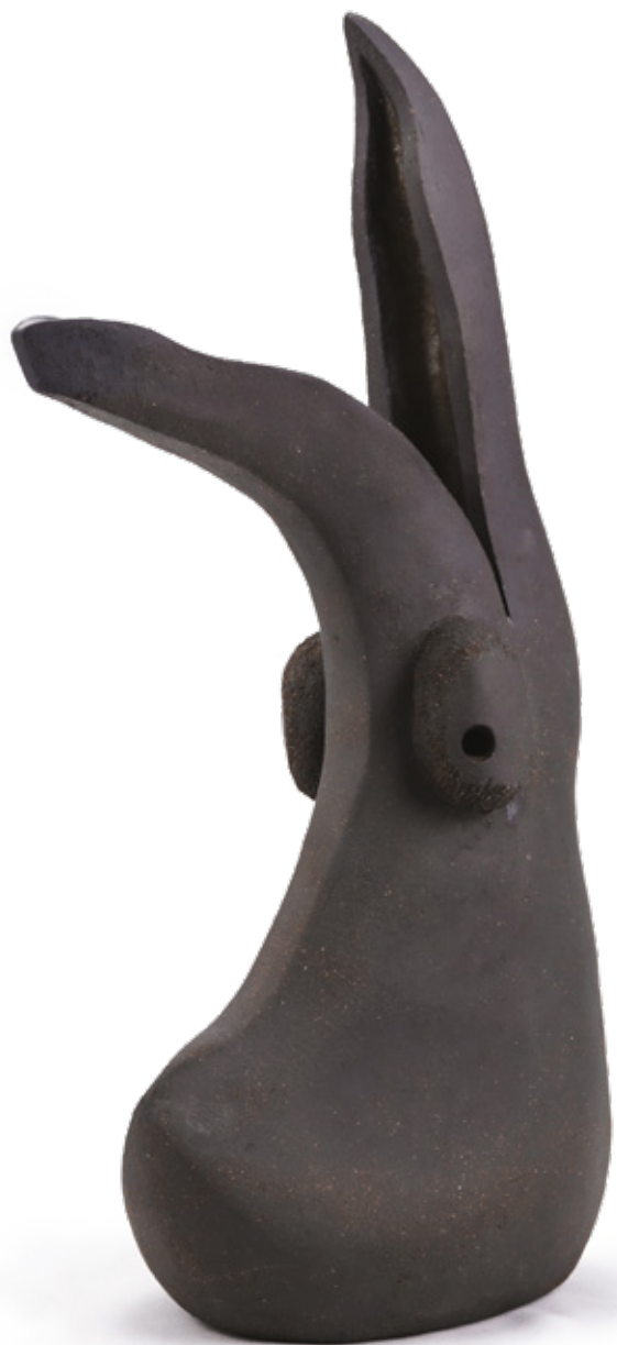
Fridoluth du contre-ut grès noir - 2022 37,9 x 11,5 x 20,9 cm