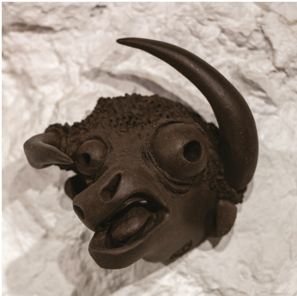
Nemausus Hilarus grès noir - 2024 18,7 x 19,5 x 12,5 cm