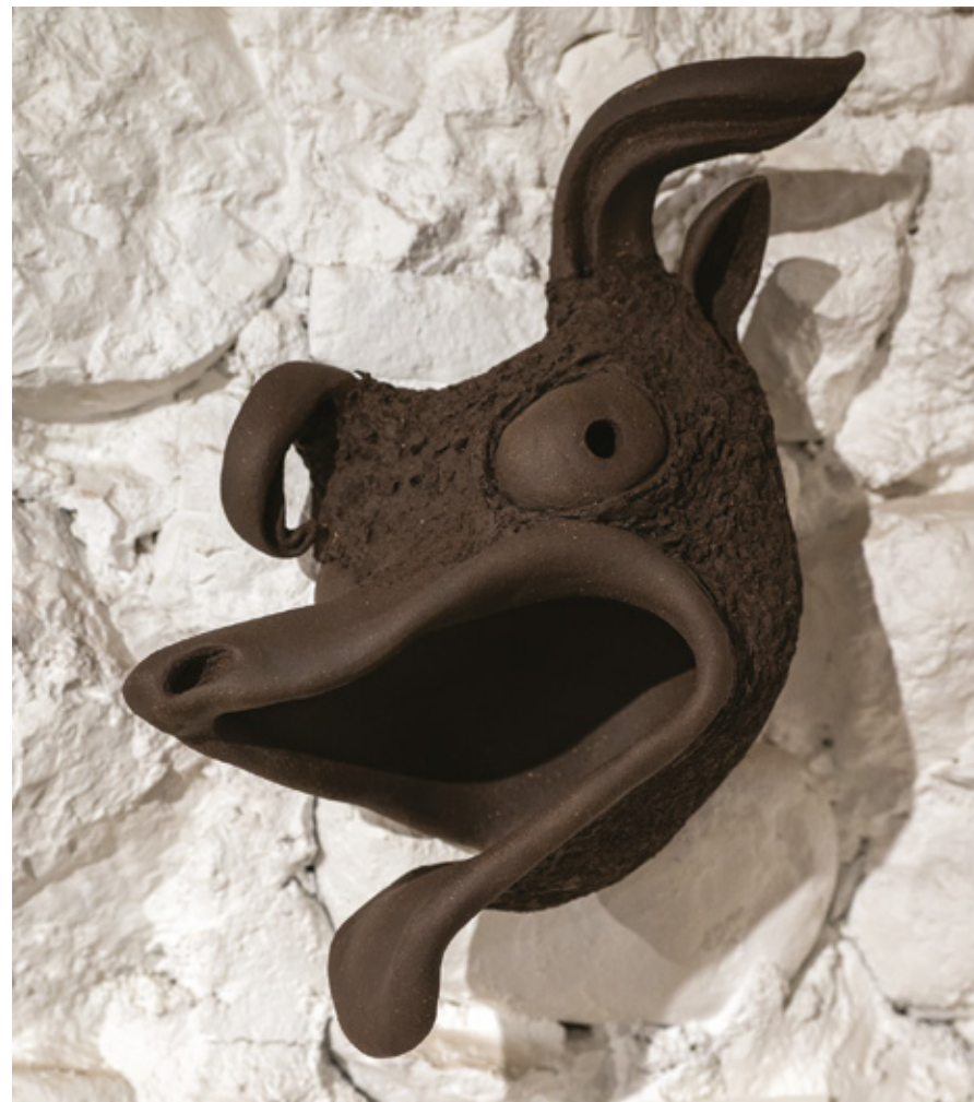
Collembole grès noir - 2025 320 x 110 x 310 mm