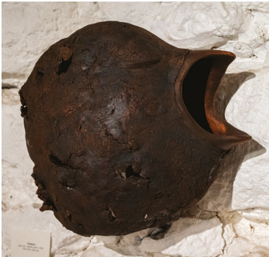
Kalepos grès noir - patine cuivre - 2025 276 x 324 x 392 mm